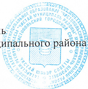
Д. А. Иванов

Глава города Чистополь Чистопольского муниципального района